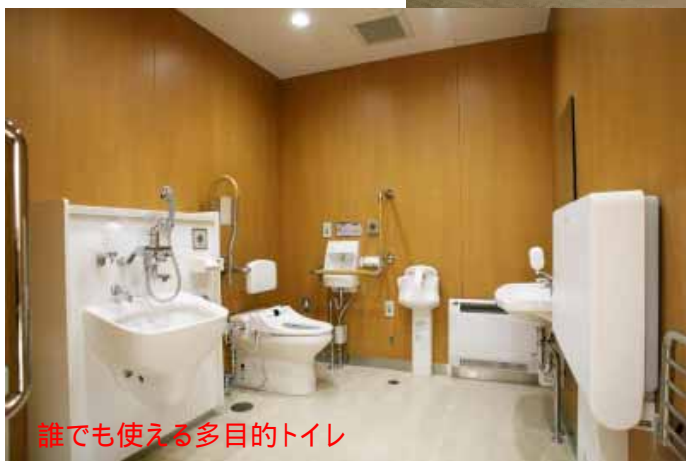
誰でも使える多目的トイレ