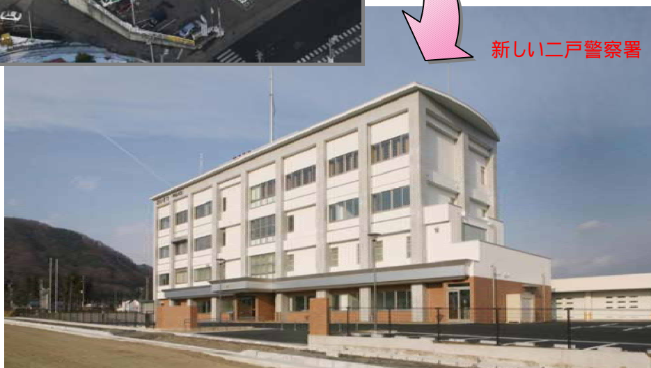
新しい二戸警察署