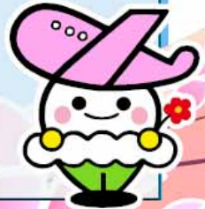
いわて花巻空港イメージキャラクター「はなっぴー」