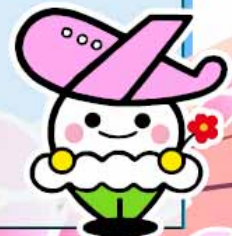
いわて花巻空港イメージキャラクター「はなっぴー」