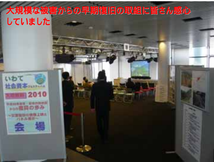
大規模な被害からの早期復旧の取組に皆さん感心していました