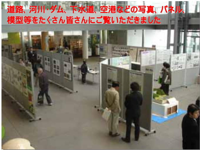
道路、河川・ダム、下水道、空港などの写真、パネル、模型等をたくさん皆さんにご覧いただきました