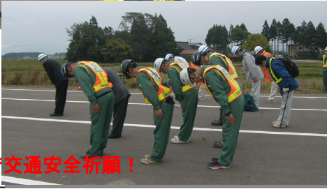
工事関係者で交通安全祈願！