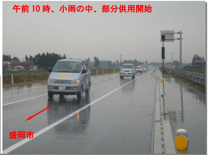
午前10時、小雨の中、部分供用開始