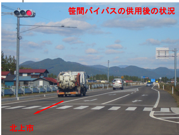
笹間バイパスの供用後の状況