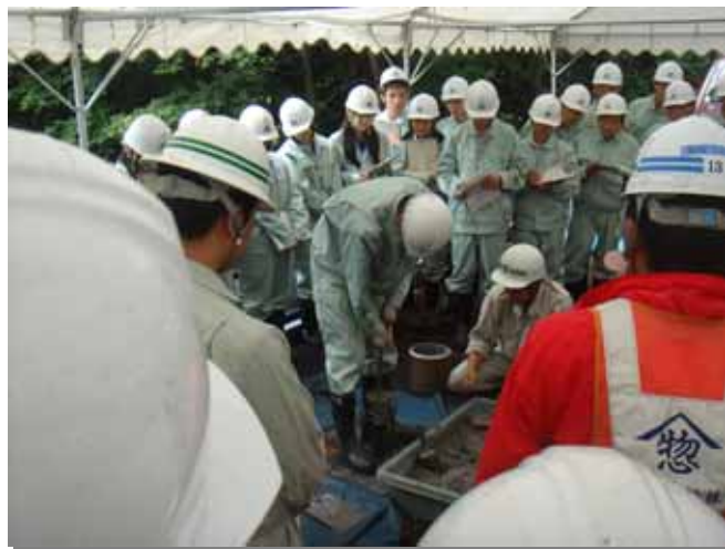
コンクリートの現場試験を実体験！見学している生徒の目も真剣です。

津付ダム建設事務所では、付替国道工事について学校等団体での現場見学の希望があった場合に現場見学会を開催しています。現場の見学を希望する場合は、安全対策に万全を期す必要があるため、事前に津付ダム建設事務所にお問い合わせ願います。