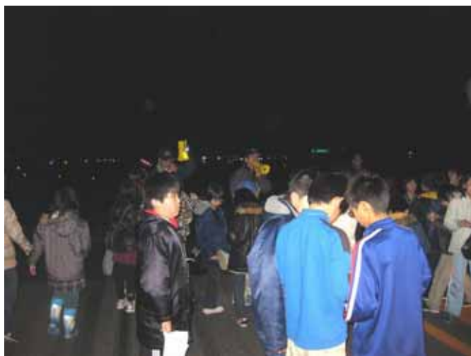
夜の滑走路を体感