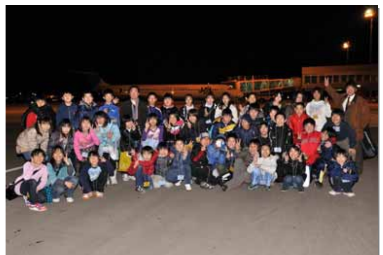
航空機とみんなで記念撮影！