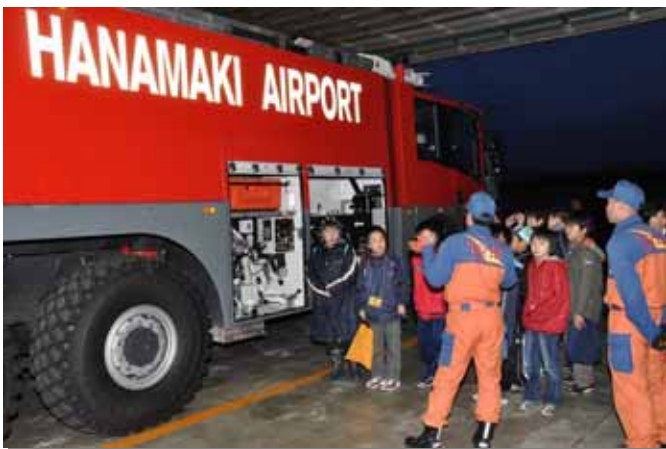
空港化学消防車を見学

今後とも、関係者が連携して空港に対する関心を高め、より身近ないわて花巻空港となるよう取り組んでいきます。