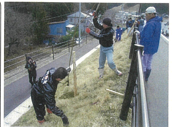
道路の斜に桜を植える参加者の皆さん