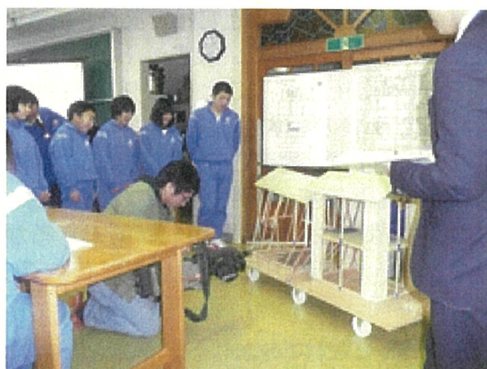
山根中学校での講義の様子②