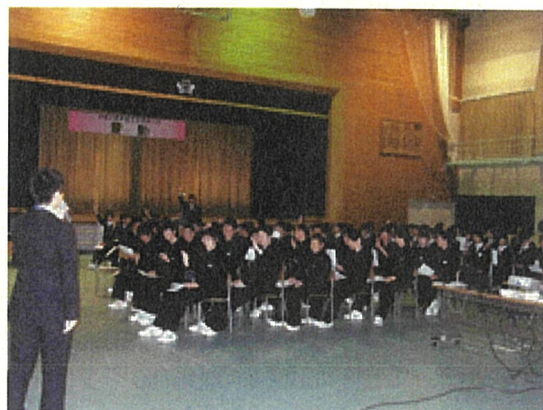
宿戸中学校での講義の様子②