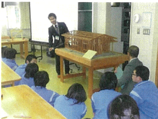
山根中学校での講義の様子①