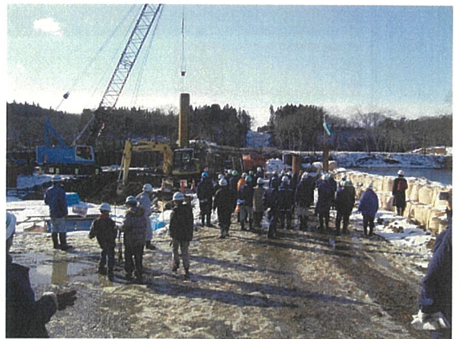
5号 橋脚 くい基礎見学