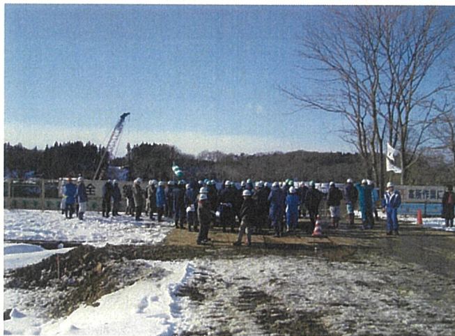
H20年度工事の全体説明

“工事を生で見ることができてよかった。”あるいは“どういうふうに工事をしているかよくわかった。”等、住民の方々に工事や事業への理解を深めていただき、有意義な見学会となりました。