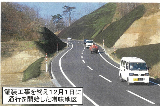
舗装工事を終え12月1日に通行を開始した嚙味地区

この全線開通により、奥州市胆沢区、衣川区で生産される農畜産物や農業生産資材の輸送に大きな効果をもたらすことが期待されています。