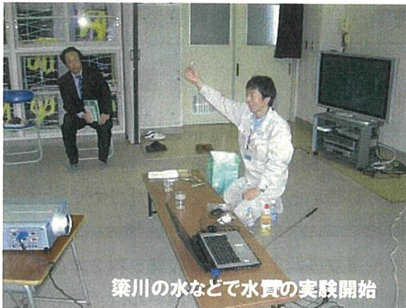
築川の水などで水質の実験開始