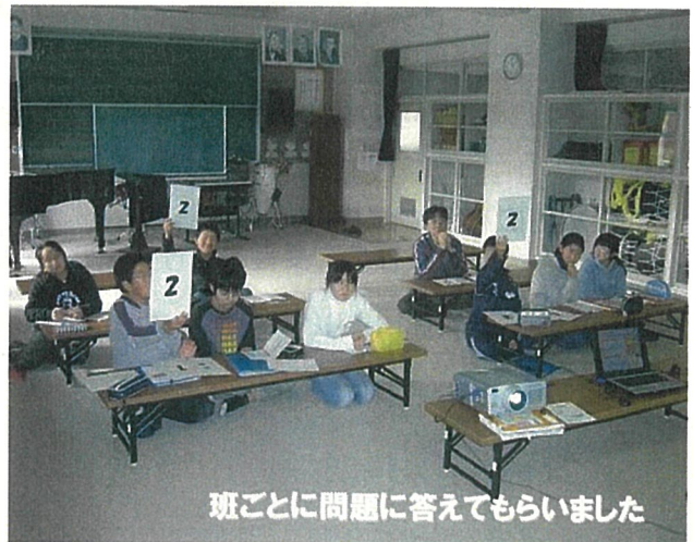
班ごとに問題に答えてもらいました