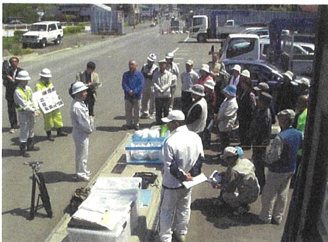
(写真：佐藤土木部長挨拶)