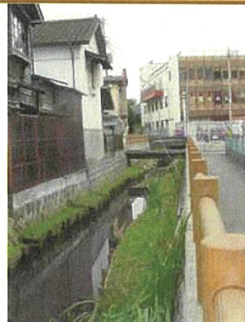
山口川浸水対策事業（宮古市）