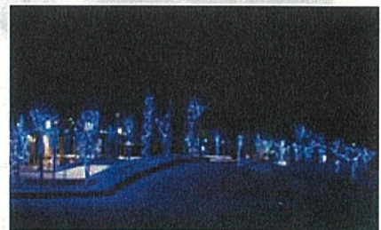
イルミネーションの様子