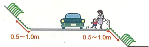
図 草刈り範囲イメージ