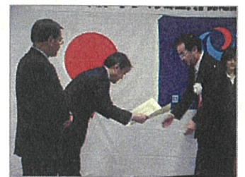
(認定証を受け取る盛岡市助役)