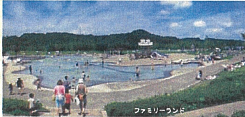
ファミリーランド

[御所湖広域公園のHP] http://www.pref.iwate.jp/~hp1008/gosyo_park/park_01.htm