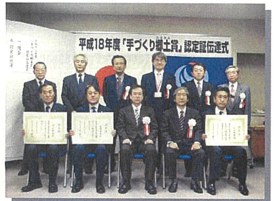
(写真下段左から、雫石町長・盛岡市助役・東北地方整備局長)