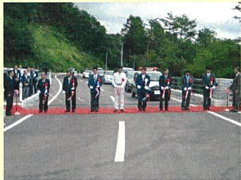
一般県道田野畑岩岩線「沼袋工区」開通式

沼袋工区は、これらの問題解消を図ることなどを目的とした延長約1.9kmのバイパスで、本区間の完成により、円滑な自動車交通と自転車及び歩行者交通の安全が確保されるとともに病院へのアクセス向上が可能となります。