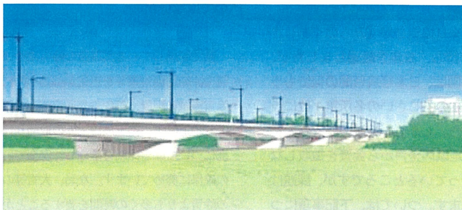
(仮称)中央大橋完成イメージ