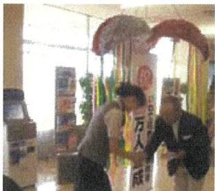
いわて花巻空港年間利用者数