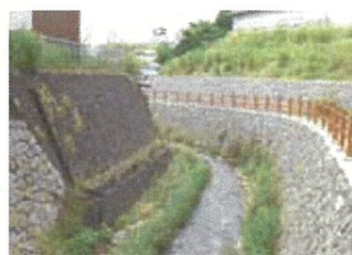
左岸ビオフィルム⇒

階段護岸は極力幅を広くし、親水性、利便性を考慮するとともに、飛石で落差工を形成しました。