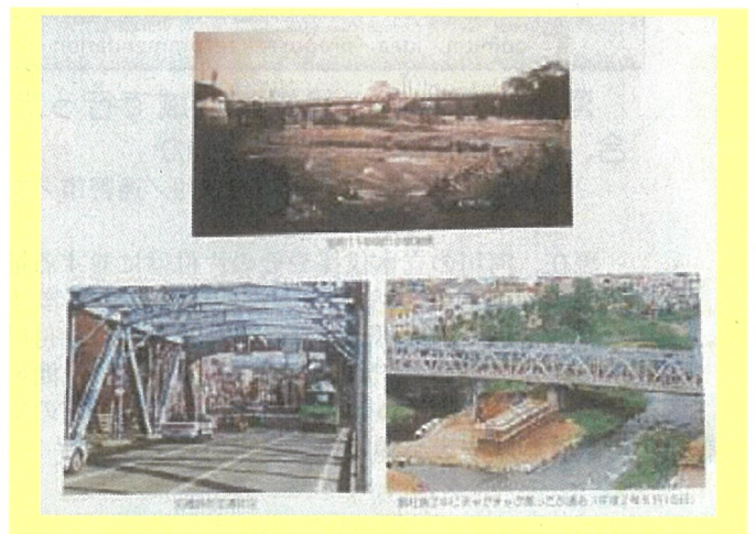
「いわての土木遺産100選」((財)岩手県土木技術振興協会発行)