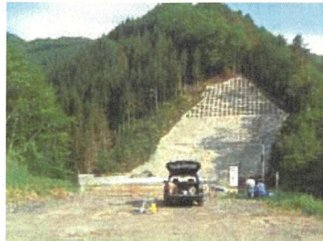
国施工の滝観洞トンネル方面を望む