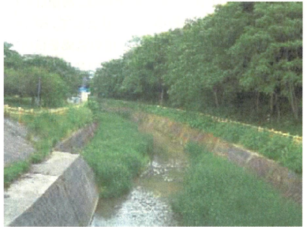
下水道整備状況(後川流域水洗化率)