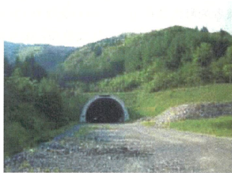
県施工の秋丸トンネル