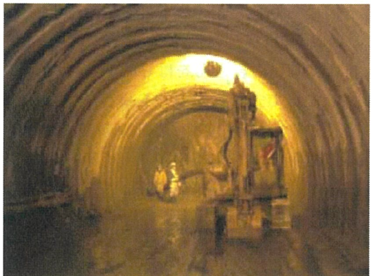
トンネル掘削作業状況

現在、花崗閃緑岩の強風化部分を抜け、地山が一番硬い部分に達しており、日進約 7m のペースで掘削中です。