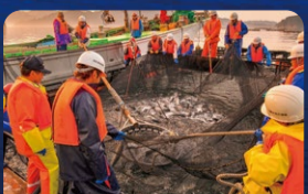
ムニエル、薫製から刺身まで◎ 岩手・三陸・やまだ オランダ島サーモン [山田町]