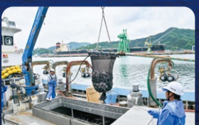
希少なサクラマス味わう 釜石サクラマス [釜石市]