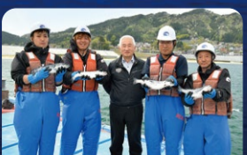
食味のよい「活じめ」サーモン 岩手大槌サーモン [大槌町]