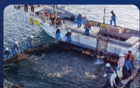
山ぶどうを食べて育った 久慈育ち琥珀サーモン [久慈市]