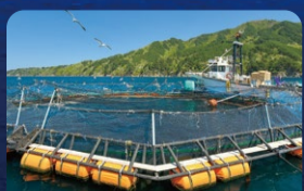
身が締まって脂乗りのよい 宮古トラウトサーモン [宮古市]