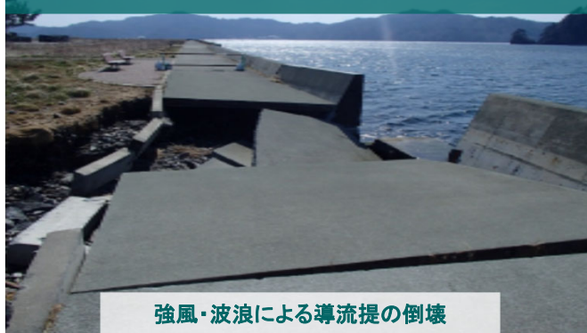
強風・波浪による導流提の倒壊