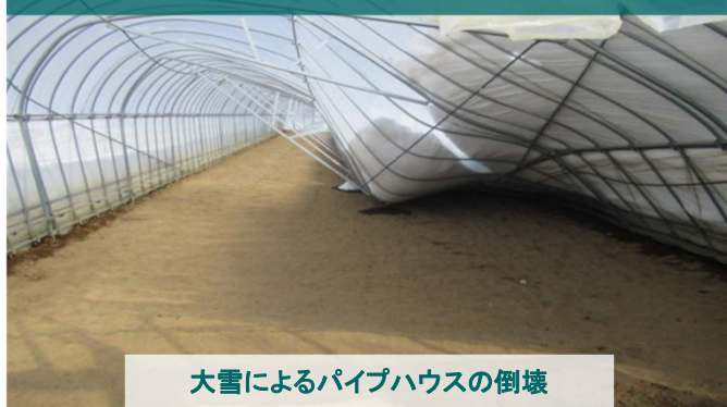
大雪によるパイプハウスの倒壊