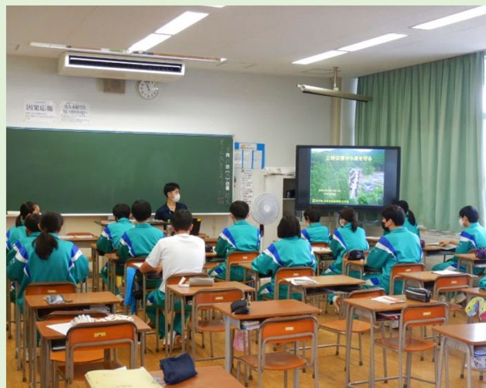
土砂災害について学習