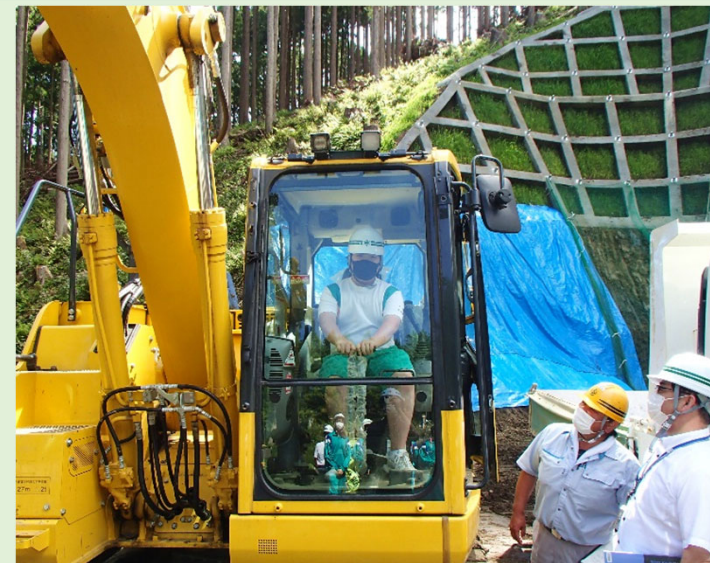
重機の大きさを確認