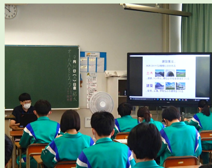
建設業について学習