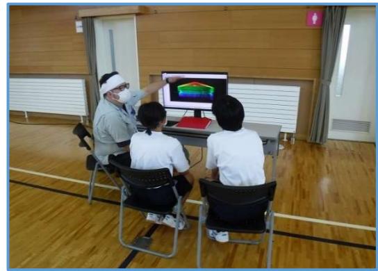
4.測量データの確認