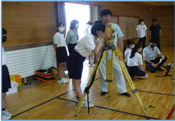
1.トータルステーション観測