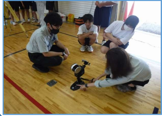
2.レーザー測量（SLAM）説明