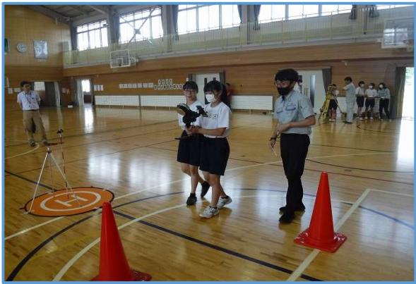
3.レーザー測量（SLAM）操作