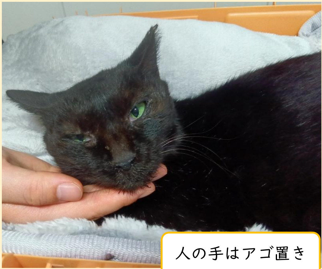
人の手はアゴ置き