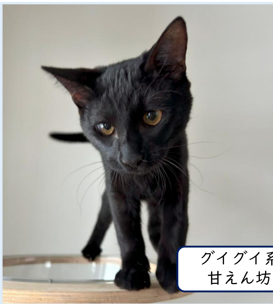
グイグイ系 甘えん坊