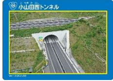
②小山田西トンネル