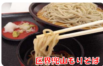
区界兜山もりそば

一般国道106号の宮古市と盛岡市の市境に位置し、名勝「兜明神岳」を背景に自然豊かな風景や登山、ハイキングが楽しめます。令和3年3月に売店とフードコートを一フロア化してリニューアルオープンし、レストランで人気だったメニューをフードコートで提供しています。