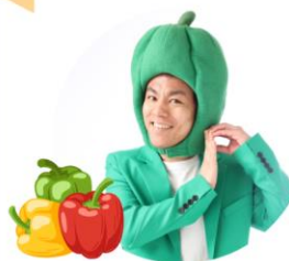
よこっちピーマン氏