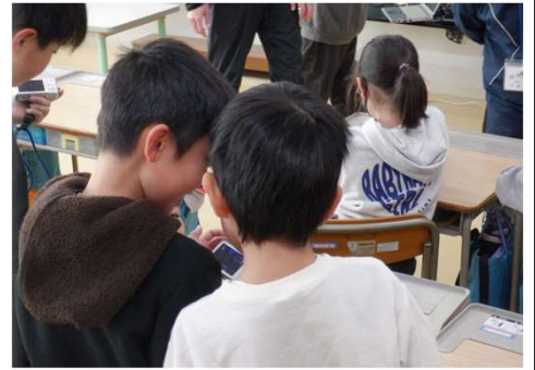
↑撮った写真をクラスの友達と紹介し合いました！

2日目は、写真に選んだ理由やタイトルをつけて景観シートを作成し、班ごとに小学校周辺の「好きな景観マップ」を作成しました！