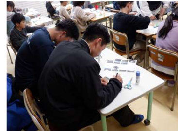
↑好きな景観、残念な景観、気になる景観など選んで景観シートを作成！