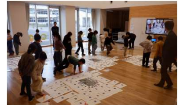
景観マップを作成し、観賞会をしました！

参加した生徒達からは、「マップに写真を貼っていくのが楽しかった。」や「室根の木々や田畑がずっと残っていてほしい。」などの感想がありました。