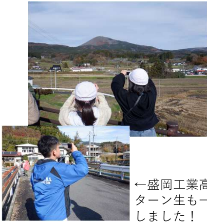
←盛岡工業高校のインターン生も一緒に参加しました！

今回は2日間とも、盛岡工業高校のインターンシップ生2名が生徒達に交じって学習に参加しました！！