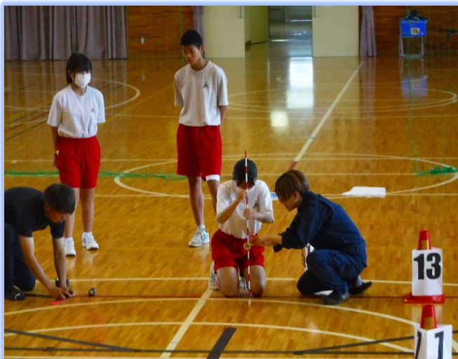
トータルステーションを用いて、参加生徒全員で校章を体育館に描画