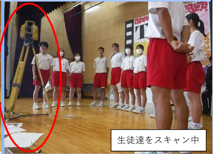
生徒達をスキャン中