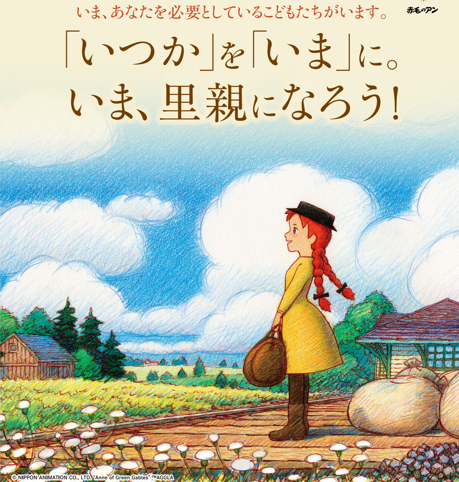
© NIPPON ANIMATION CO., LTD. "Anne of Green Gables"™AGGLA

あたたかな家庭を心から願ったアンは、マッシュとマリラに出会い、二人の愛情に包まれながら、自分らしく豊かで幸せな人生を歩みます。 いま、日本には親と離れて暮らすこどもたちが、約4万2千人います。「里親制度」は、そうしたこどもを自分の家庭に迎え入れ、必要な生活費や養育に関する相談など、さまざまなサポートを受けながら育てる制度です。 こどもの成長には、とによりで応援してくれる大人が必要です。こどもたちの力になれるのは、あなたです。