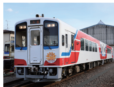
開業40周年記念列車