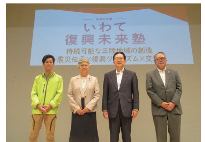
基調講演・事例報告後の記念撮影の様子

基調講演・事例報告の様子は、動画配信サイトに掲載していますので、是非ご覧ください。