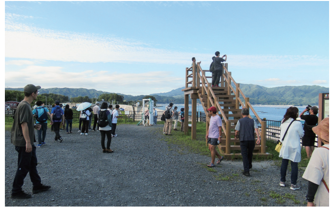
山田湾展望広場から山田湾を望む参加者

験ビューローの語り部ガイドの案内で、語り部自身の震災の経験、新しいまちづくり・商店街の再生等の話を聞きながら歩き、防災・まちづくりについて学びました。