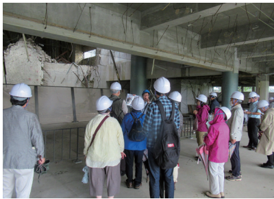
旧道の駅高田松原タピック45内を見学する参加者

午前9時のエクスカーションでは、高田松原津波復興祈念公園パークガイドの案内で、公園内の視察が行われ、36名が参加しました。この