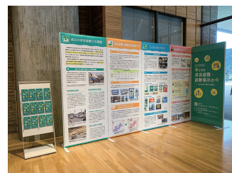
第2回企画展示の様子