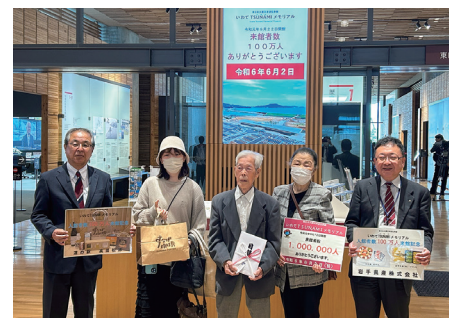
記念品を贈呈しました