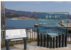
祈りのモニュメント

東日本大震災津波の犠牲者の追悼と、震災の記憶を決して風化させることなく未来への教訓とする象徴的な場として、令和6年3月、大船渡市大船渡町茶屋前のみなと公園内に、祈りのモニュメント、津波伝承碑、東日本大震災犠牲者芳名板が建立されました。