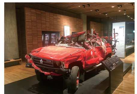
100万人の皆様にご覧いただいた消防車