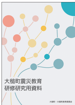
大槌町震災教育 研修研究用資料