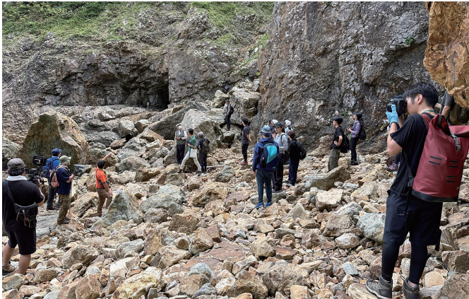
中級者向けコースをトレッキングする参加者

午前、田野畑村において、「みちのく潮風トレイルガイドウォーク」を行いました。海の景観をダイナミックに感じることができる「みちのく潮風トレイル」コース内を、NPO法人体験村・たのはたネットワークのガイドの案内で、中級者向け1コース、初級者向け2コースのトレッキングを行いました。