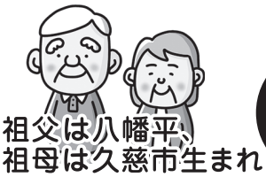
祖父は八幡平生まれ 祖母は久慈市生まれ