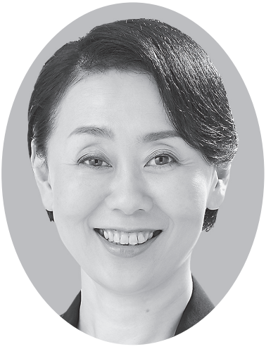
立憲民主党公認 衆議院議員候補者

政治とは誰のためにあるのだろうか。私の疑問でした。戦後の混乱や数々の危機を越え、先人達が日本の復興と発展のために尽力してきました。しかしいま、国民は、長期にわたる一強政治が招いた混乱に失望しています。政治、税制、教育、社会保障制度を見直し、いまこそ、国民本位の政治を取り戻さねばなりません。経済格差の拡大や気候変動など、問題は山積しています。これをひとつひとつ解決するのが政治の役割です。己を律した政治を実現し、国民がそれぞれの幸せを追求できる日本を、皆さまとともに築いて参ります。