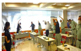
2024 健康経営優良法人 Health and productivity