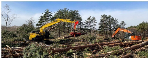
建設業新分野進出事業 令和5年受賞