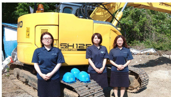
女性活躍・次世代育成・パパ育休も推進中！

設立34年、仕事とプライベートを両立すべく4週8休を導入し新分野進出取組みも優秀賞をいただきました。更に上記認定の他に健康経営認定もいただき尚も働きやすい職場に改革中です！