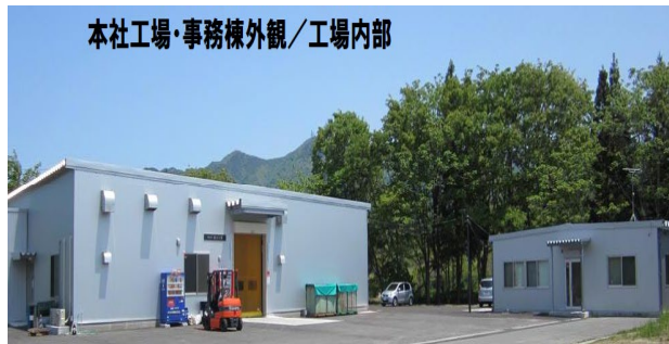
本社工場・事務棟外観/工場内部