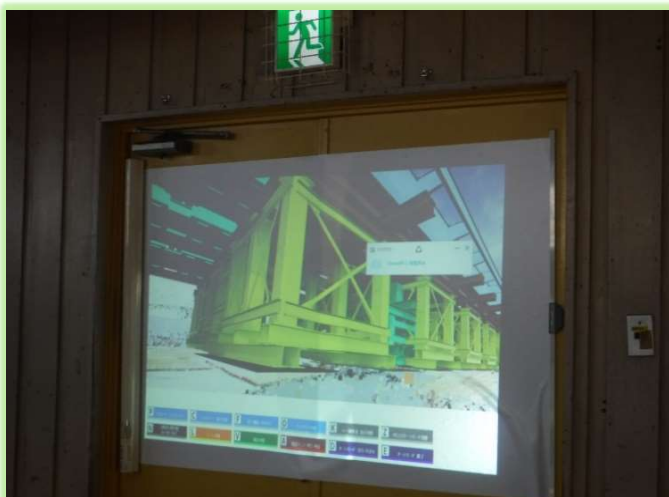
VRで工事現場を再現したものを視聴