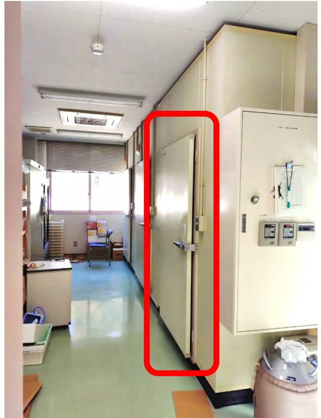
② 冷蔵庫（修繕対象：一番手前）