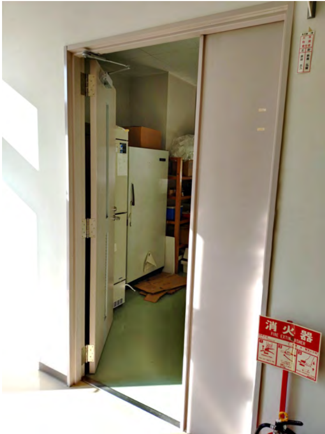
① 血液保管庫入口（家畜保健衛生所 2 階）