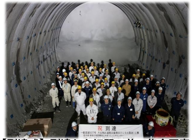
【到達式】到達した切羽の前で集合写真

総延長約1,450mのトンネル工事について、令和5年7月に西和賀町側から掘削を開始し、本年10月1日に約1,390m(約96%)の掘削が完了しました。 10月11日には、工事受注者主催のもと「到達式」が開催されました！式典には、工事関係者約50名が出席し、万歳三唱や鏡開きなどを行い、無事故・無災害で西和賀町側からの掘削が無事完了したことを祝いました。 残る約60mの掘削は、令和7年春に反対側(北上市側)から施工する予定です。