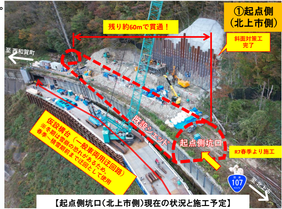
【起点側坑口(北上市側)現在の状況と施工予定】