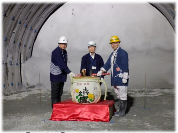
【到達式】受発注者で鏡開き