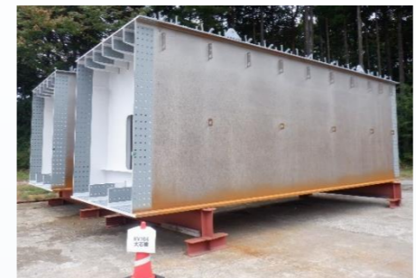
【橋梁上部工工場製作中】