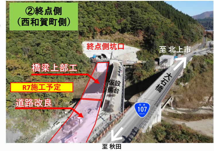
【終点側坑口(西和賀町側)現在の状況と施工予定】