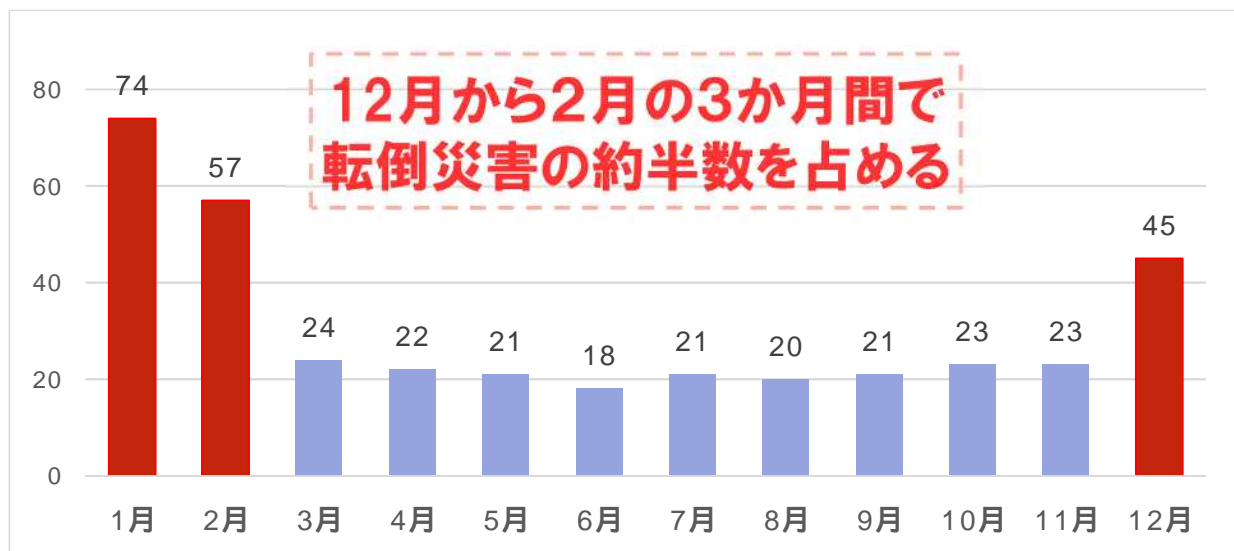
岩手労働局 過去10年平均の月別転倒災害発生状況