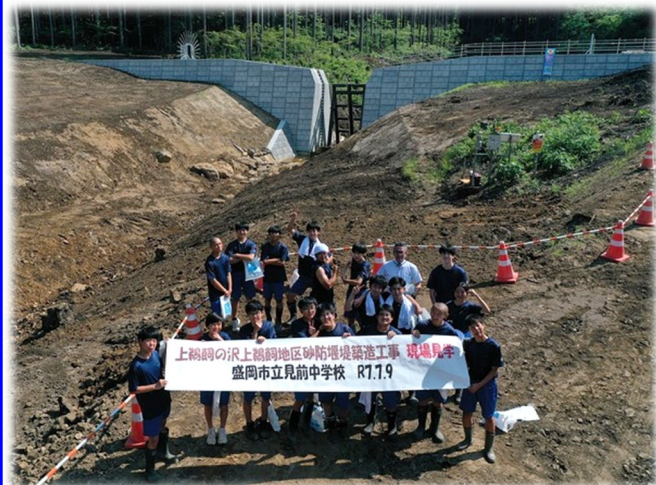
上鵜飼の沢砂防堰堤 築造工事 (滝沢市) 令和7年7月9日 盛岡市立見前中学校 【盛岡土木部】