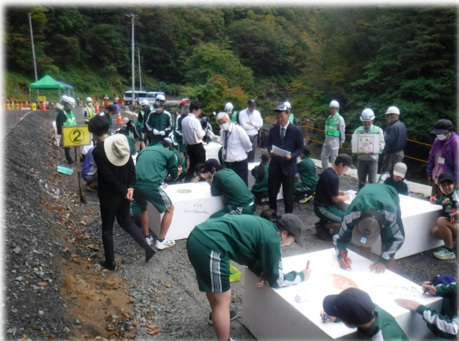
国道281号 案内～戸呂町口地区 道路改良工事 (久慈市) 令和7年10月6日 久慈市立山形中学校 【県北土木部】