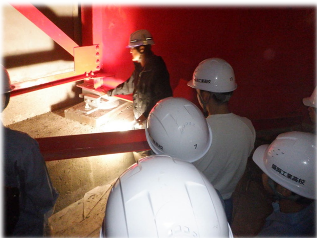
主要地方道盛岡横手線 大村橋 補修工事 (雫石町) 令和7年8月27日 岩手県立盛岡工業高校土木科 【盛岡土木部】