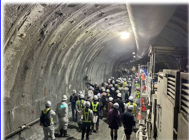
国道107号 大石トンネル 築造工事 (西和賀町) 令和6年6月9日 西和賀町のみなさま 【北上土木センター】