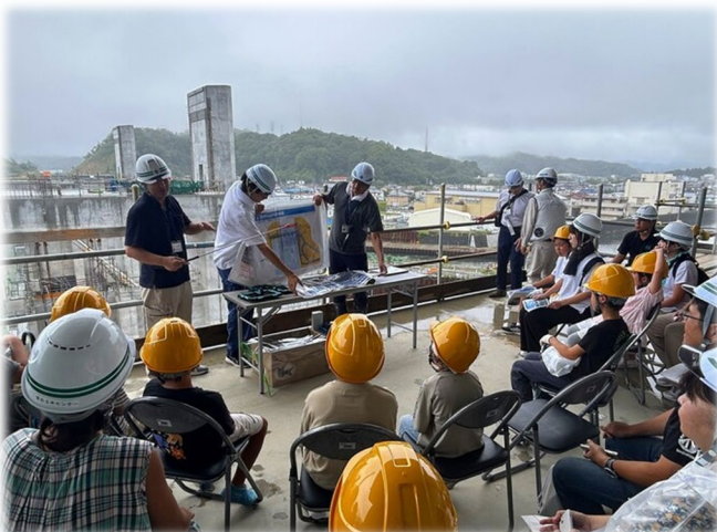
閉伊川水門 災害復旧工事 (宮古市) 令和7年8月2日 親子現場見学会 【宮古土木センター】