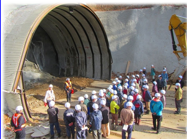
国道282号 佐比内トンネル 築造工事 (八幡平市) 令和6年10月30日 八幡平市立田山小学校 【岩手土木センター】