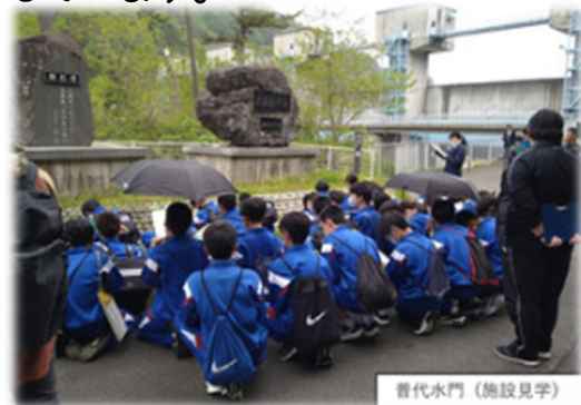
曹代水門 (施設見学)