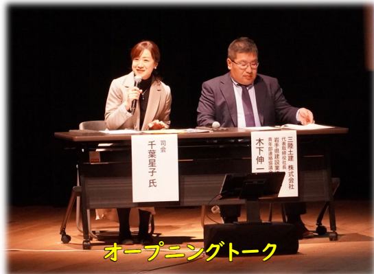
オープニングトーク