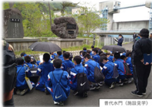
昔代水門 (施設見学)