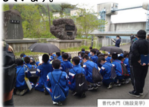
昔代水門 (施設見学)