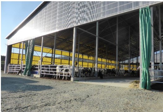
フリーストール牛舎

1 度に 50 頭搾乳できるロータリーパーラーにより、ホルスタイン種経産牛約 650 頭を飼養する県内トップクラスの酪農経営体。