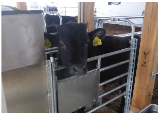
哺乳ロボットによる子牛管理

黒毛和種の繁殖牛約140頭と肥育牛約170頭、日本短角種の繁殖約70頭と肥育約120頭を飼養する県内トップクラスの肉用牛一貫経営。