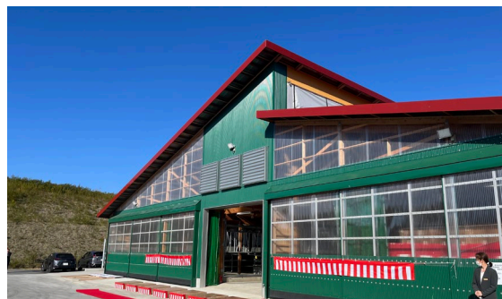
令和6年10月に完成した育成牛舎