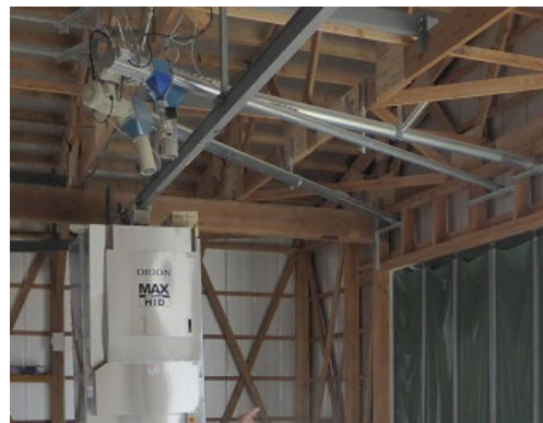
肥育牛の発育に応じた量を 給与する自動給餌機