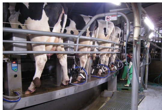
ロータリーパーラー