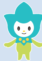
岩手県予防医学協会 公式キャラクター アーリー

表面のQRコードから参加申込をして下さい。 プログラム内容及び時間は変更となる場合がございます。 変更の際は結核予防会HPにてお知らせいたします。