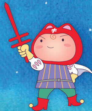
複十字シール運動 イメージキャラクター シールぼうや