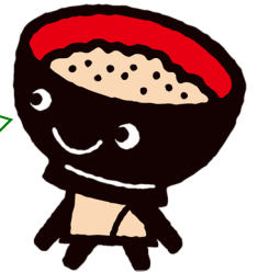
わんこきょうだい こくっち