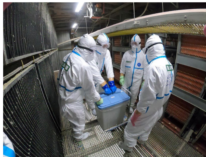
殺処分作業