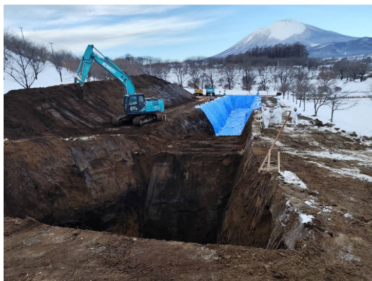
埋却地での掘削作業