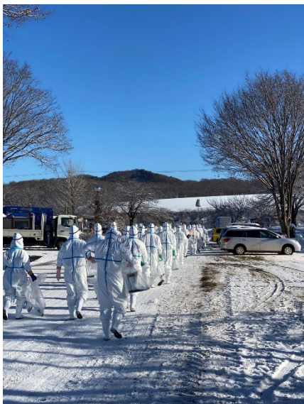
作業のため農場へ移動