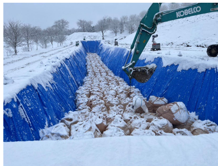
処分鶏等の埋却作業