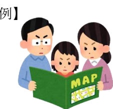
防災マップで避難場所 や避難経路を確認