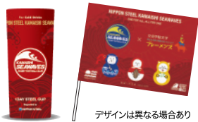
デザインは異なる場合あり

循環型社会を目指し開発された「1Day Steel Cup」のオリジナルカップ(621ml)と、文京学院大学東日本大震災復興支援プロジェクト「プレーメンズ」とのコラボミニフラッグを無料配布!