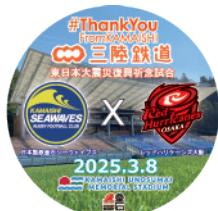
オリジナル缶バッジ